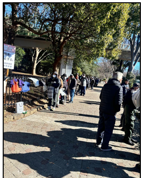
写真2-食料を受け取るホームレスの方々